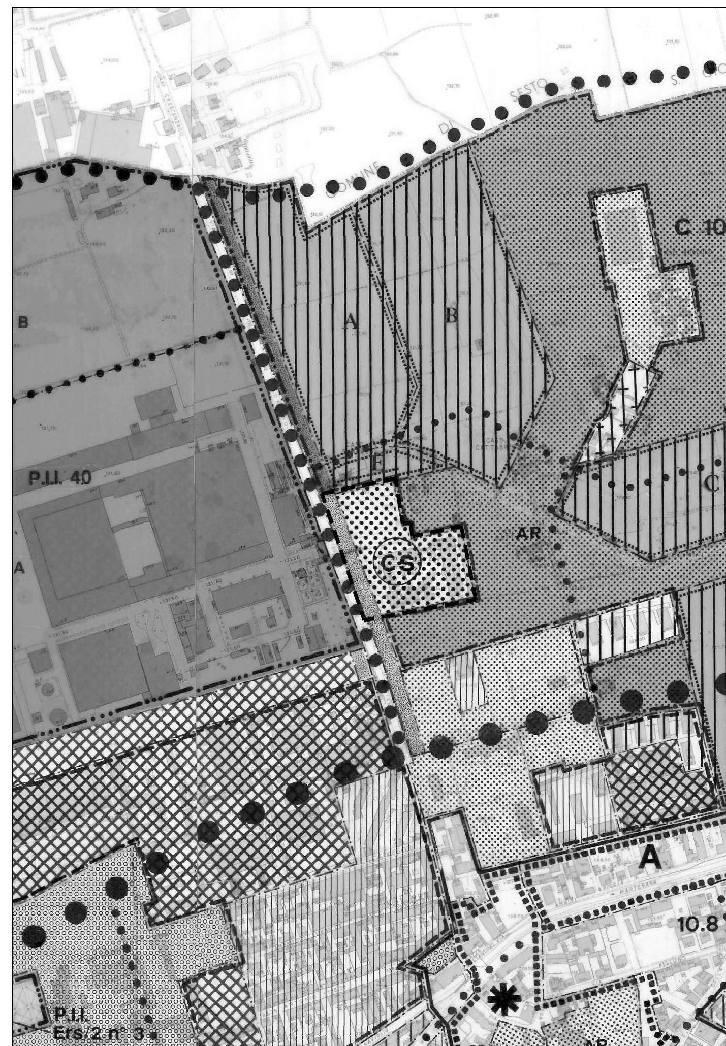
STRALCIO DI P.R.G. VIGENTE - scala 1.5000